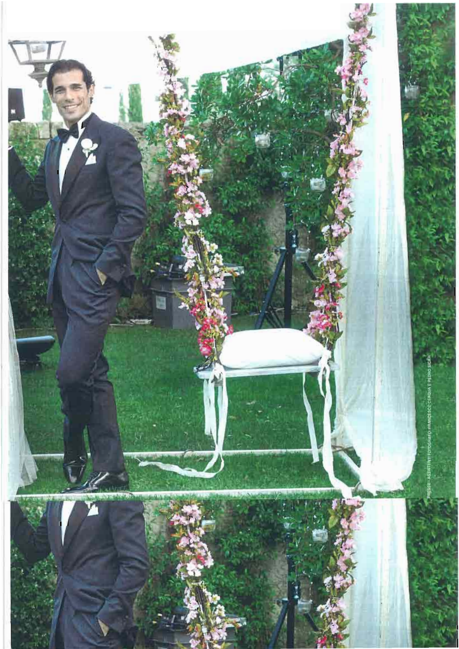
FRESSE - ASSISTENTI FOTOGRAFO - FRANCESCO CERQUA E RILINDO BUCARI